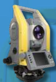
Механический тахеометр Trimble C5