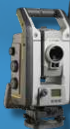
Trimble S7 Электронный тахеометр