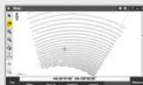
Стандартная сетка сканирования

Благодаря технологии SureScan производится съемка всех необходимых данных для создания цифровых моделей местности и вычисления объемов земляных работ. Кроме того, топографическая съемка выполняется значительно быстрее, чем при использовании традиционных методов измерений.