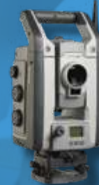
Trimble S9 Электронный тахеометр