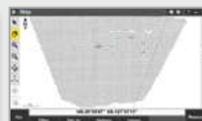
Сетка сканирования SureScan