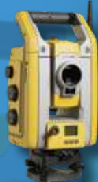
Trimble S5 Электронный тахеометр