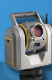
Trimble SX10 Электронный тахеометр