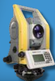
Механический тахеометр Trimble C3