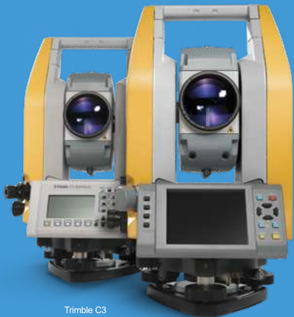
Trimble C3 механический тахеометр